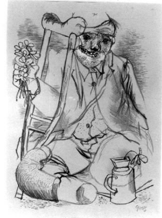
George Grosz: The Hero (1936)

Inom sunnigrenen av islam råder strikt förbud att avbilda profeten Muhammed. På samma sätt får inte Gud avbildas inom judendomen. Därför innebar Jyllandspostens Muhammedkarikatyrer (2005) en psykologisk bomb, som med enorm sprängkraft detonerade i den muslimska världen. Dels genom avbildningen som sådan, men i ännu högre grad på grund av det förakt och förlöjligande av profeten som bilderna så tydligt gav uttryck för.