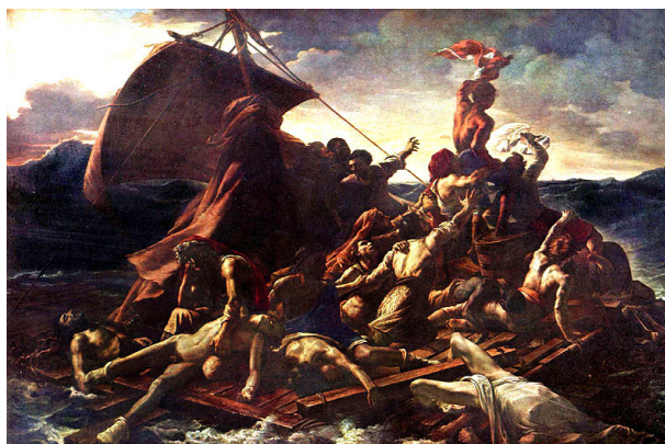
Theodore Gericault: Medusas flotte (1819)

– Jag kan inte måla en ängel, för jag har aldrig sett någon, sa han och avbildade realistiska naturscener och svettdoftande människor i hårt arbete (t.ex. Stenbrottet ). Hans tavlor hänades och refuserades på konstsalongerna i Paris, vilket fick honom att arrangera en egen utställning i ett tält utanför.