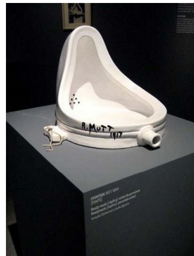
Marcel Duchamp: Fontain (1917)